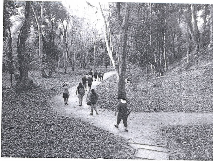
Fig3: Visitantes sitio arqueológico Yaxha

Se realizan recorridos para observar las actividades de visita en la zona de uso público del Parque.