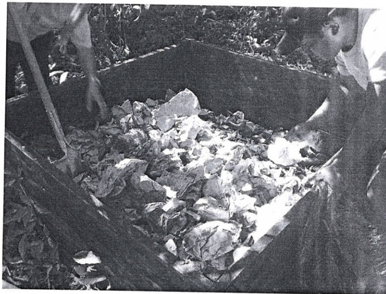
Fig.4: Compostaje de residuos

Con el fin de darle continuidad al manejo de las composteras del Parque se realiza un calendario para la recolección de residuos degradables para evitar la contaminación de los contenedores y áreas de almacenamiento.